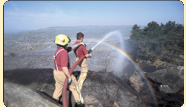
ایجاد رنگین‌کمان بر اثر آب آتش‌نشان‌ها، انگلستان