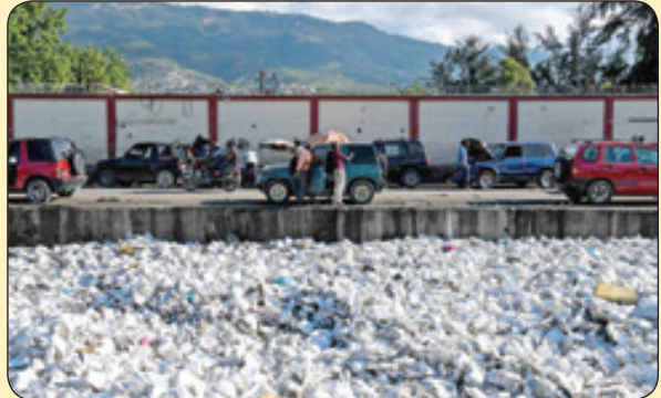
هجوم زباله‌ها به ساحل رودخانه، هاییتی

بوند، بیمار شدند و مردند. عجیب این که در طول سه هفته، شش بار این بارش اتفاق افتاد. یکی از شهروندان، نمونه‌ای از این مواد ژلاتینی عجیب را جمع‌آوری کرد و به آزمایشگاه تخصصی در یک بیمارستان محلی برد. کارشناسان متوجه شدند این ماده حاوی گلبول‌های سفید خون انسان است. بررسی موضوع به وزارت بهداشت محول شد. محققان میکروب‌شناس بعد از آزمایش نتیجه گرفتند که این ماده ژلاتینی دو نوع باکتری دارد که یکی از آن‌ها به طور طبیعی در سیستم گوارشی در ایالت واشنگتن، ساعت حدود سه صبح، بارشی عجیب آغاز شد. قطره‌ها، شفاف و گلوله‌ای از جنس ژلاتین و به اندازه دانه برنج بودند. همان روز تعدادی از مردم به بیماری سختی دچار شدند که علایمی همچون مشکل در تنفس، سرگیجه، تاری دید و تهوع داشتند. تعداد زیادی از گربه‌ها و سگ‌های خیابانی که در تماس مستقیم با این ماده قرار گرفته