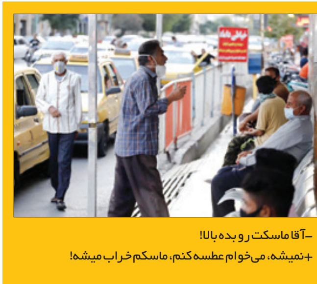
آقا ماسکت رو بده بالا!

نمیشه، می خوام عطسه کنم، ماسکم خراب میشه!