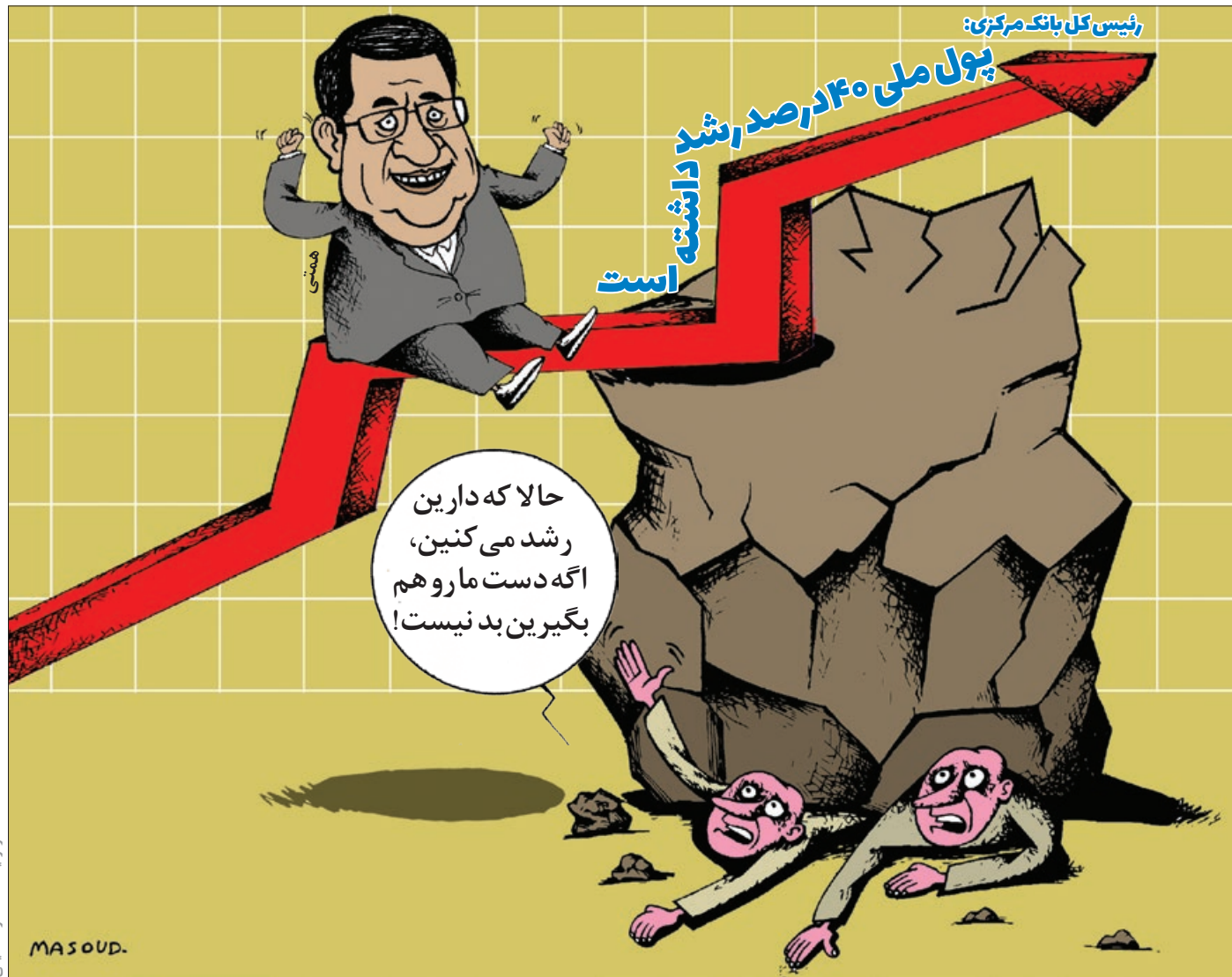
کار نویسند: مسعود مرعشی