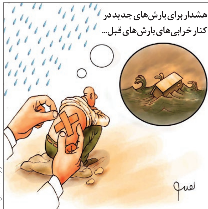
کار نویسند: حسین تقیپور