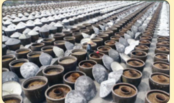
ساخت سس سویا به روش سنتی، چین

برای تو رنگین کمانی بر گردن ابرها آویخته‌ام... حمید درخشان