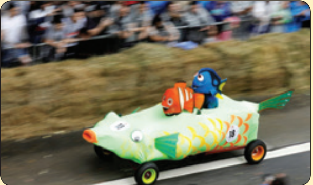
رویتزا | مسابقه خودروهای دست‌ساز، برزیل