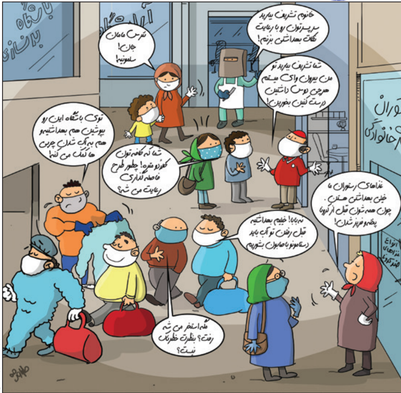
کار نویسندگانه طرول نیکی