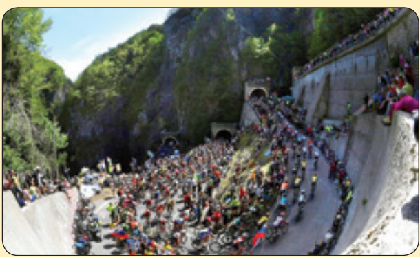
مسابقات دوچرخه سواری، ایتالیا