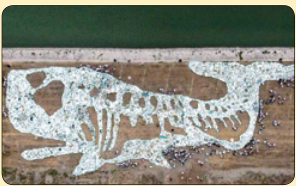
ساخت یک نهنگ ۶۸ متری با زباله‌های پلاستیکی داخل اقیانوس برای هشدار به حفاظت از محیط زیست، چین