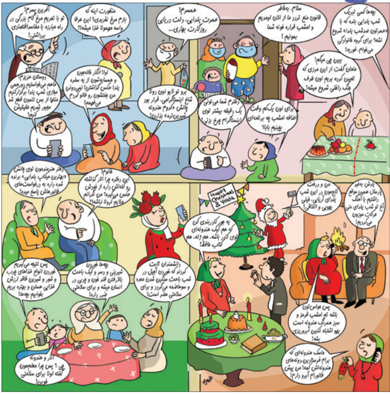
کارتون: سوسه روز