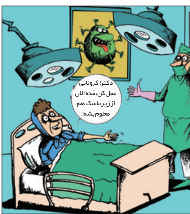
کارتون: مسعود هاشمی