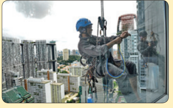
گاردین | شیشه پاک کردن در ارتفاع، سنگاپور