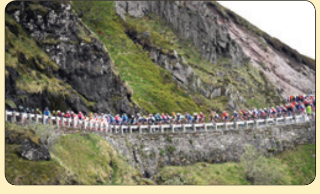
مسابقات دوچرخه سواری کوهستان، فرانسه