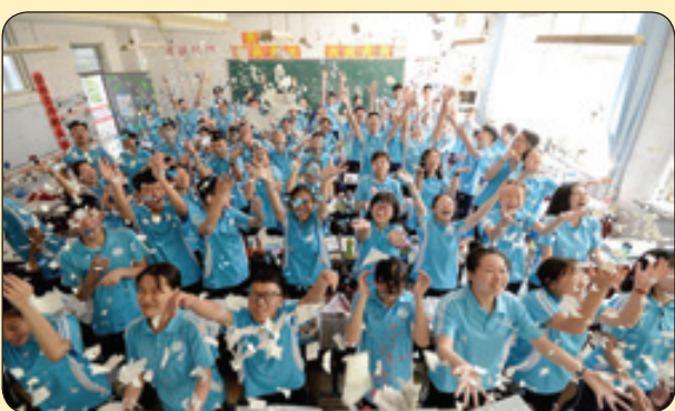
گاردین | جشن پایان سال تحصیلی، چین