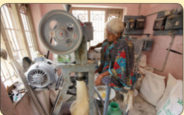
رویتز | ساخت رشته سنتی، هندوستان

لوازم مورد نیاز: دو جعبه کبریت، یک سکه و یک قیچی توضیح تزدستی: انجام این شعبده کاملا آسان است. ابتدا دو جعبه کبریت را برمی داریم و روی هر کدام از طرف یکی از ضلع های کوچک شان شیار ایجاد می کنیم. شیار ایجاد شده باید به شکلی باشد