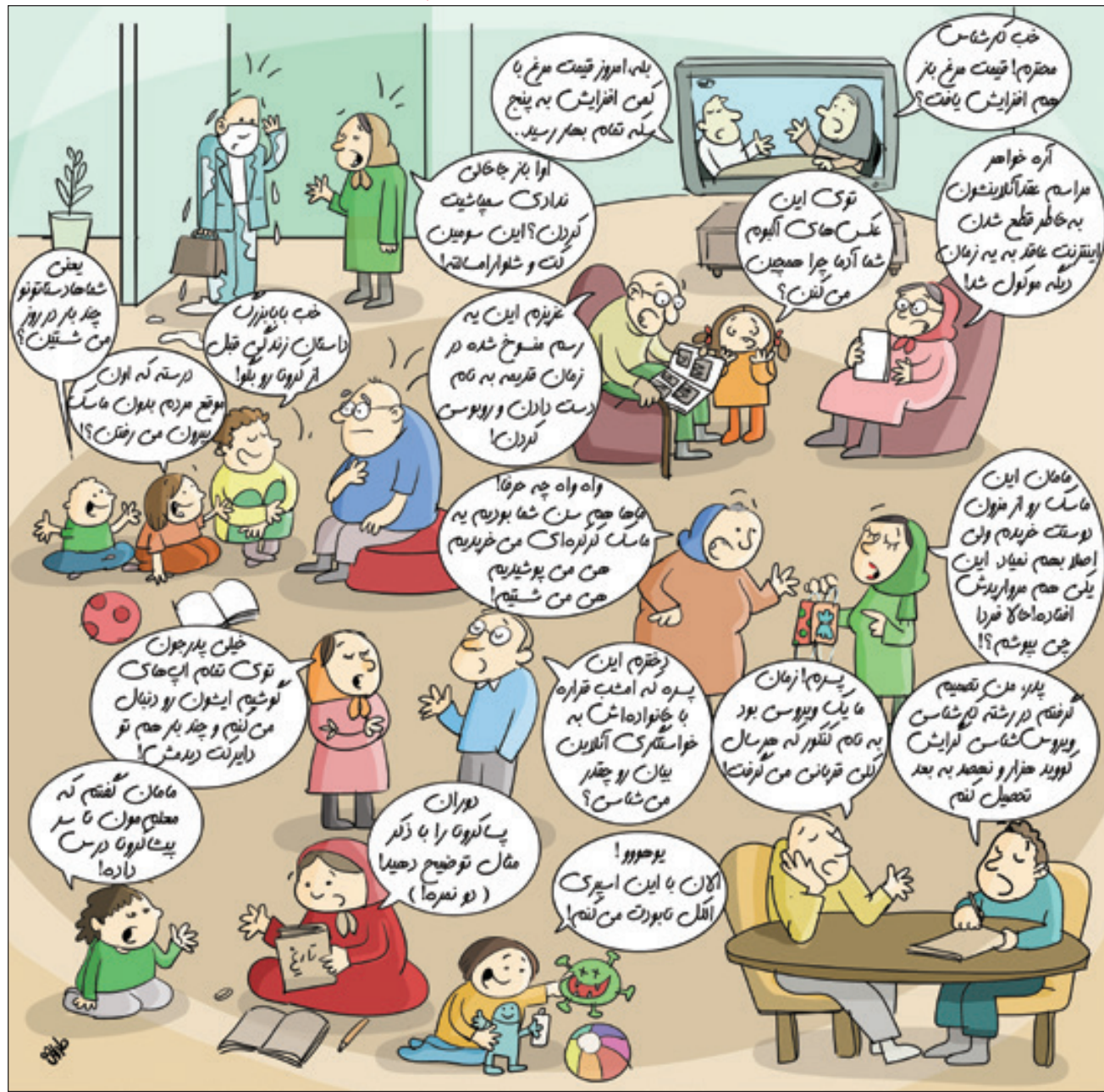
کارتوننویست: طراوت نیکو